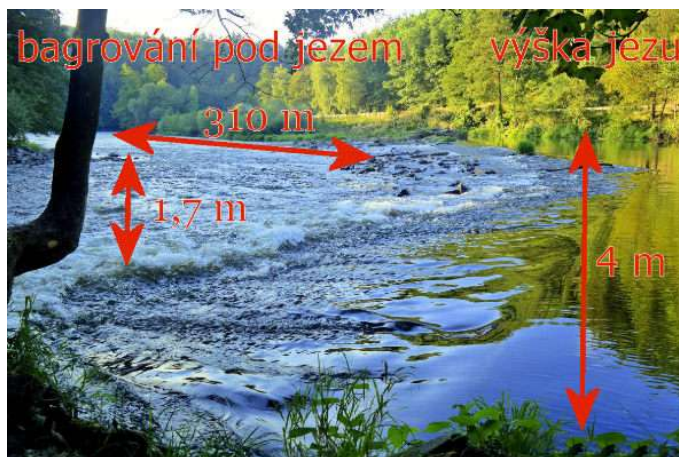
V Dubině má být vybudován 4 m vysoký a nebezpečný jez spojený s bagrováním toku